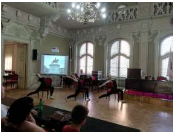
ГОДИШЊИ КОНЦЕРТ ШКОЛЕ КУЛТУРНИ ЦЕНТАР ПАНЧЕВО, 14. ЈУН 2019