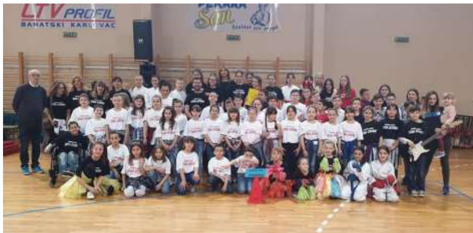
Гостовање на Дечијој смотри фолклора, 07.04.2019.